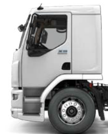
Extended Day Cab