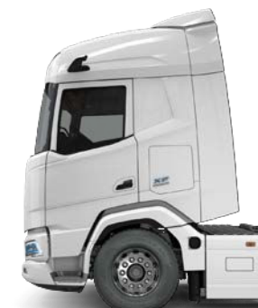
Sleeper High Cab

* La capacité totale équivaut à la taille maximale des batteries. La capacité Disponible correspond à la quantité d'énergie à disposition du véhicule.